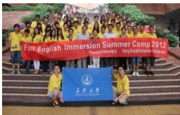
图 8 举办的全浸式英语夏令营

在整个课程体系中，毕业设计（论文）是大学教育的关键环节之一，是学生从校园与走向工作的衔接点，也是检验教学效果的有效措施。对应于“双语”教学模式改革，长安大学开创了“中英文”毕业设计（论文）的先河，如图 9。在中英文毕业设计过程中，学生一直处于中英文语言、知识、文化的交互作用之中，培养了学生如何交替使用中文和英文与专业人士交流的能力，真正成为既“懂”英文又“懂”专业能够服务于企业“走出去的”的创新型人才。