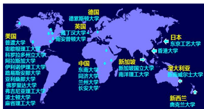
图 4 国际化师资的地缘组成

为了确保国际化涉外型人才培养模式的顺利实施，长安大学专门成立了创新型人才教育中心，招聘海归博士为常规双语教学力量，并负责国际班的教学与管理。目前，该专业已经引进海归博士 30 余名专职从事国际化教学，如图 4。同时，签约其他有海外留学、进修背景的教师为双语教学服务，并与香港理工大学每年开展合作，对签约的双语教师定期进行系统培训，提升双语教学能力和水平。