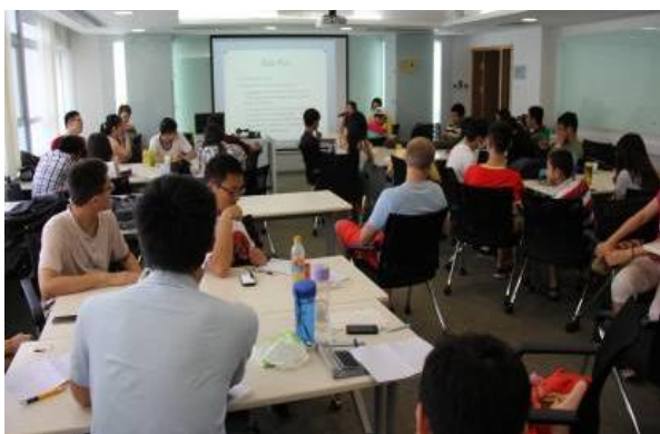
图 7 英语高级口语课程

为了确保国际化涉外型人才培养模式的顺利实施，在通识课程阶段除开设综合英语主干课程外，特聘外教开设高级阅读、高级口语、商务写作等课程（如图 7），强化培养了人才的英语听说读写的综合能力。并积极有效利用国际知名大学网络资源、国外大学远程授课资源、海外来访教师资源，共享双语教学的成功经验。特别是在与香港理工大学的大力支持下，利用每年暑期时间成功举办全浸式英语夏令营（Full English Immersion Summer Camp，如图 8），提升学生行为语言表达能力，更加深对中西方文化差异的了解。到中交集团、中建集团、中国港湾集团等海外工程项目实地实习，提升了学生商务语言和国际规则表达与运用能力。