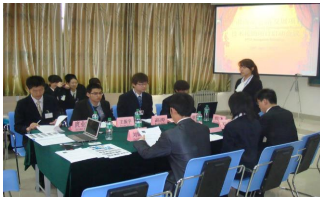
图 6 情景模拟与角色扮演