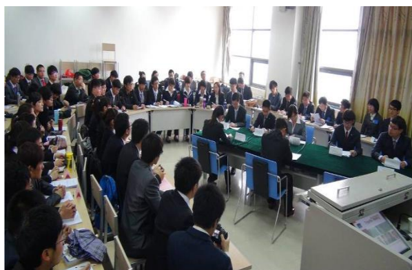
图 5 开放式的教学环境

通过持续建设，构建了一支稳定的高水平双语教学队伍，鼓励教师在教学中，积极探索参与式教学、案例教学、情景模拟与角色扮演等新型教学方法，推动教学管理模式变革，形成教师、学生共同参与的教学管理新局面，如图 5、图 6。