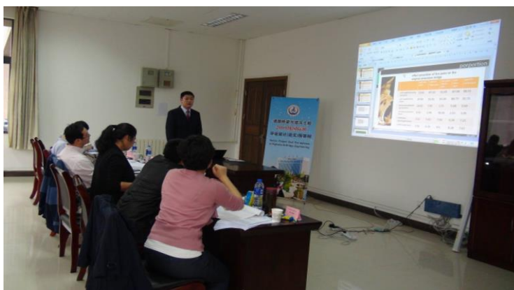
图9 中英文毕业设计答辩现场